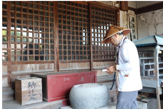
第七十三番「救世堂」