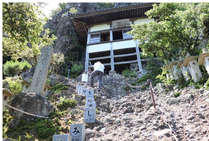
途中から 1 本の鎖に変わりました！