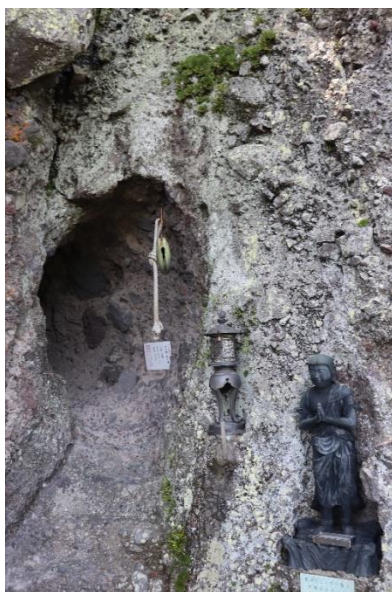
本堂は、この洞窟の中にあります！