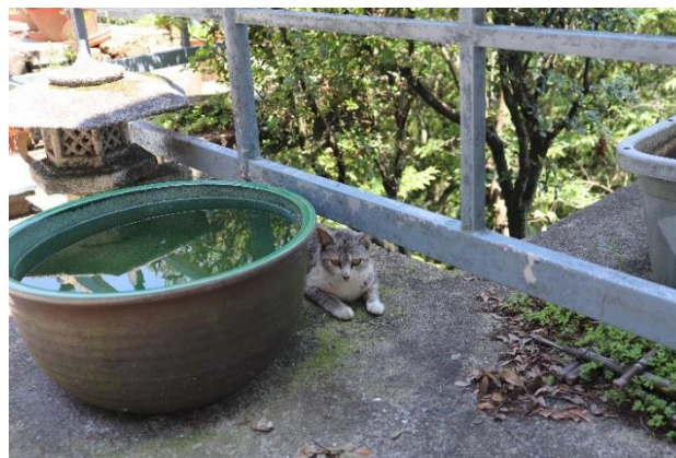
入り口では、可愛い猫ちゃんがお出迎え！