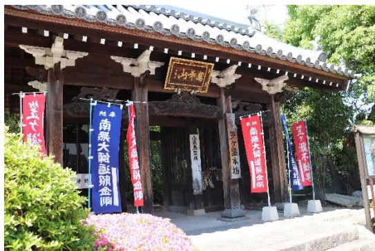
第七十二番「滝湖寺」

笠ヶ瀧を降りたあとは、第七十二番「滝湖寺（りょうこうじ）」と第七十三番「救世堂（ぐぜどう）」でお参りし、私のお遍路初日は無事に終了しました。