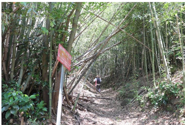
かぐや姫がいそうな竹林！

竹林を抜けると山奥にもかかわらず、石仏がぼつり、ぼつりと並ぶ不思議な山道が続きます。