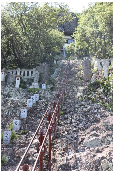
第七十二番奥の院「笠ヶ瀧」