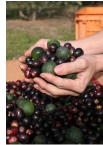
摘果した伊予柑果実 とオリーブ果実

柑橘の若い実には、成熟した実よりもヘスペリジンなどの有用成分が多く含まれます。しかし、ヘスペリジンは水に溶けにくく化粧品原料として利用しづらなのが課題でした。試行錯誤の結果、オリーブ果実と同時に搾ることによってオリーブオイルに油溶性のヘスペリジンなどの柑橘成分が溶け込むことが分かり、5年をかけて商品化しました。「伊予柑オリーブオイル」は、畑で実った果実が無駄にならないだけでなく、オリーブオイルに柑橘特有の成分や爽やかな香り、さらっとした使用感も加わった、他には類のないオイルです。